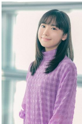
芦田愛菜（2002年6月23日生まれ、兵庫県出身）

5歳で出演したドラマ「Mother」（日本テレビ/2010）で脚光を浴び、「マルモのおきて」（フジテレビ/2011）では連続ドラマ初主演。映画「ゴースト もういちど抱きしめたい」（2010）で第34回日本アカデミー賞新人俳優賞を受賞、「うさぎドロップ」（2011）と「阪急電車 片道15分の奇跡」（2011）で第54回ブルーリボン賞新人賞を史上最年少で受賞。映画「パシフィック・リム」（2013）ではハリウッドデビューも果たす。近年では映画「メタモルフォーゼの縁側」（2022）で第47回エランドール賞新人賞を受賞したほか、ドラマ「最高の教師」（日本テレビ/2023）で第117回ザテレビジョンドラマアカデミー賞助演女優賞、第5回野間出版文化賞をそれぞれ受賞、映画「はたらく細胞」（2024）では第48回日本アカデミー賞優秀助演女優賞を受賞した。2026年春に放送予定の特集ドラマ「片想（おも）い」（NHK 総合）で主演をつとめるなど、数々の映画、ドラマ、CMなどで活躍中。