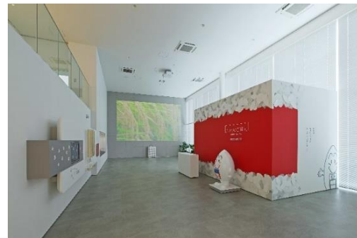
聖籠ファクトリー エントランス

聖籠ファクトリーは、2019年6月に操業を開始した「オープンファクトリー」機能を併設した当社パックごはんの専用工場です。ご来場いただいたお客様には、160mの専用見学通路から、美味しいごはんが炊き上がる過程を「観て」「聞いて」「触れて」ご体感いただけます。詳しくは、以下の要項をご参照ください。